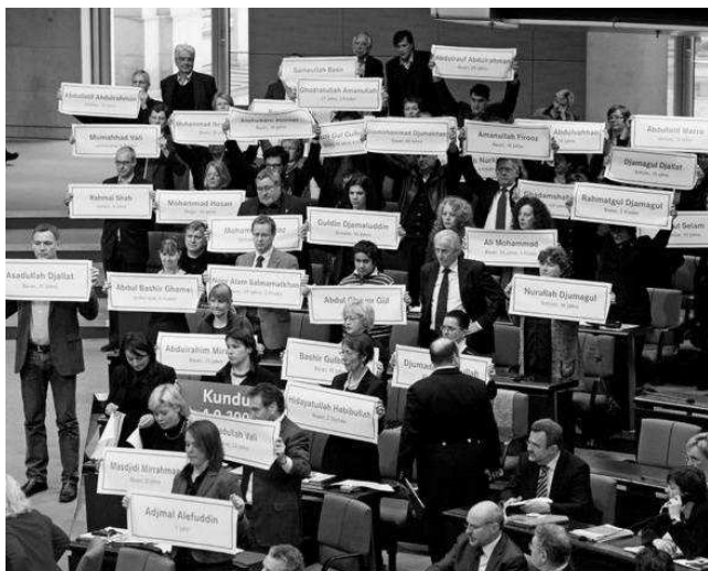
Nachahmenswert: Gedenken an die Opfer des Kundus-Massakers im Bundestag während der Debatte über die Entsendung weitere Truppen

Durch Politik und Medien werden Terrorismushysterie und Islamophobie geschürt. Damit werden der Abbau demokratischer Grundrechte, Aufrüstung und völkerrechtswidrige Angriffskriege zur Durchsetzung geostrategischer Interessen vorangetrieben. Die wahren Probleme der Menschheit sind jedoch andere: Armut, Hunger und drohende Klimakatastrophe erfordern gemeinsame Anstrengungen der Menschheit. Ohne eine konsequente Friedenspolitik ist keines dieser Problem lösbar.